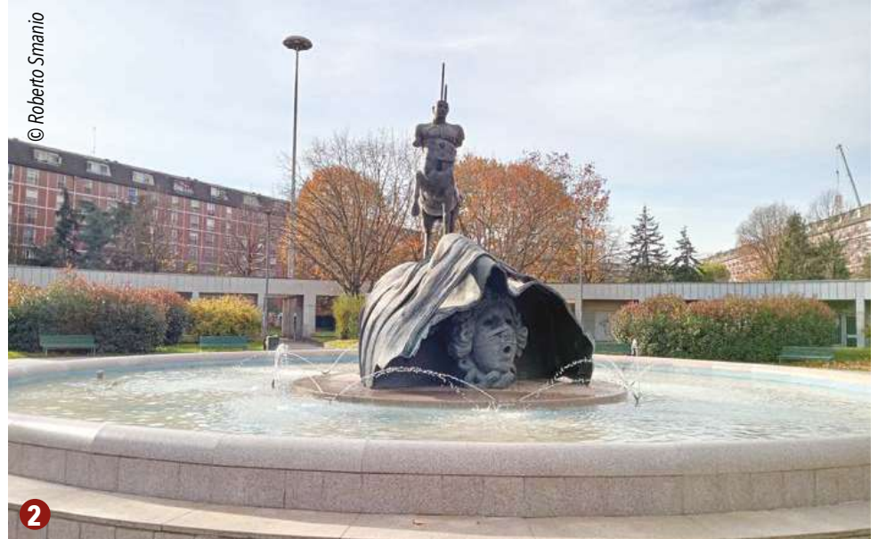
1. Architettura Quartiere Sant'Ambrogio 2. Fontana del Centauro di Igor Mitoraj 3. Il Collegio di Milano 4. Cascina Battivacco 5. Barrio's 6. Fornace Curti.